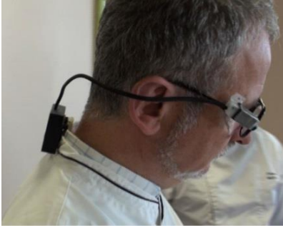
Une subcam portée par un chef cuisinier

Dans un premier temps, la captation via une caméra vidéo miniature pour :